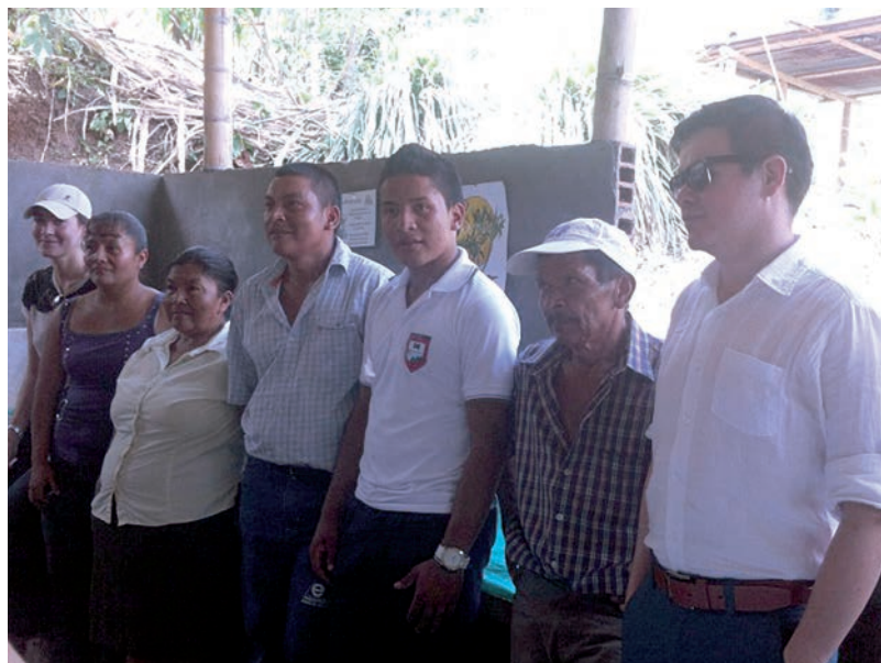
Visita proyecto de extensión y educación para jóvenes rurales (Quinchia, Risaralda 2014).