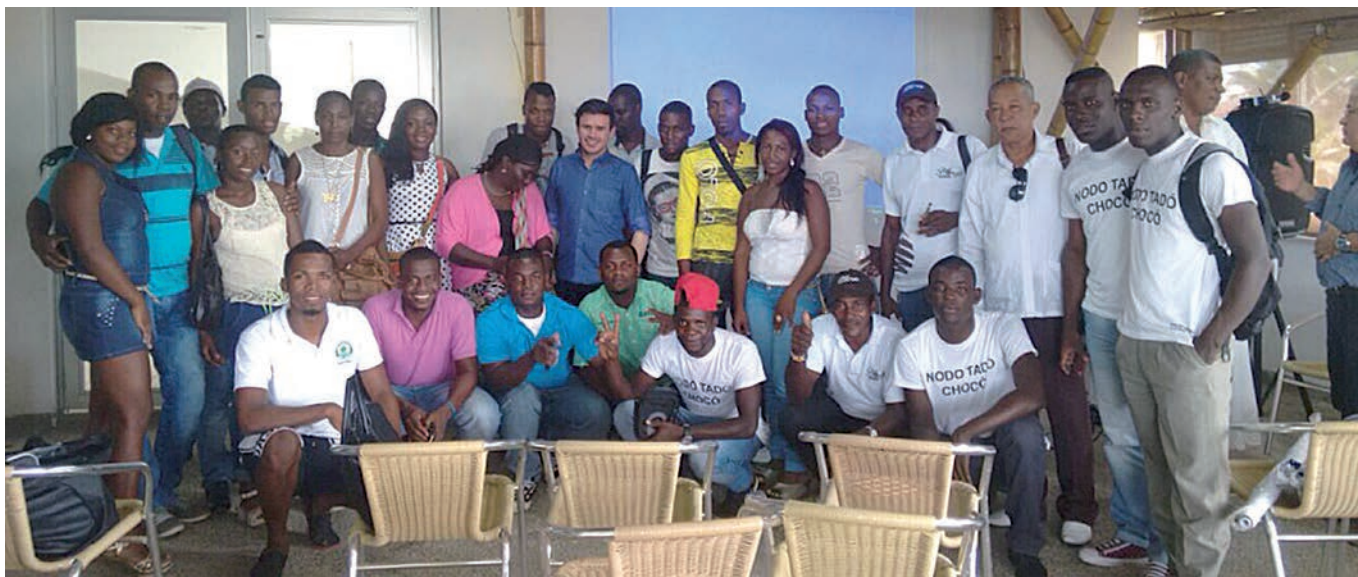
Taller con jóvenes rurales (Quibdó, Chocó 2015).