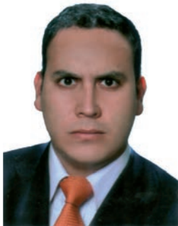
Por: Sebastián Ricardo Martínez López Asesor Jurídico Dirección General de Proyección Social Universidad de los Llanos.

Colombia se encuentra en proceso de diálogo con el objeto de lograr un acuerdo de paz con las Fuerzas Armadas Revolucionarias de Colombia - FARC, este paso definirá el rumbo que tomará el país, estamos a puertas de finalizar un conflicto armado interno que lleva más de 60 años con un grupo que tiene gran importancia militar, económica y social con una fuerte injerencia en la vida del país en todos los ámbitos, esto es algo que no podemos negar, este proceso se convirtió en la punta de lanza de la estrategia política del gobierno nacional, y reto para la presidencia, quien ve en la paz el elemento más importante en la búsqueda de la solución a los problemas del país. Este proceso ha atraído numerosos actores tanto nacionales como internacionales, que se han venido vinculando a esta idea de paz, adquiriendo unos compromisos que van más allá de la firma de estos acuerdos. El proceso es una realidad que se está dando y gústenos o no, debemos estar preparados para la transformación que tendrá el país con la firma de los acuerdos y el tan nombrado posconflicto. El gobierno nacional deberá reconocer la importancia y autonomía de las entidades territoriales y las instituciones